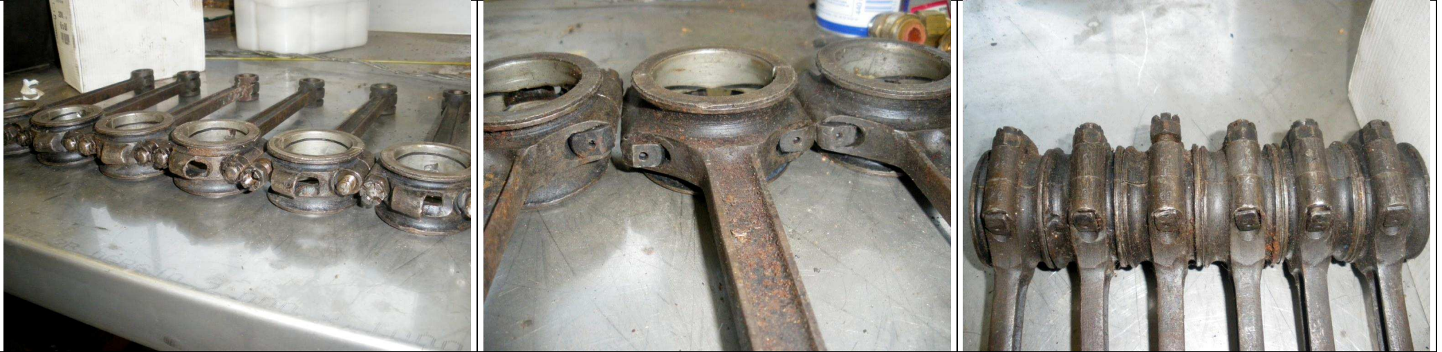
Les 6 bielles prises au hasard.

J'ai récupéré ce moteur en pièces détachés. Je ne sais pas pourquoi il a été démonté (peut-être à cause des bielles coulées ?). Je ne connais pas la position exacte des bielles dans le moteur car je ne connais pas la numérotation adoptée par PL. Si quelqu'un connaît... Vincent BOUCHARD le 26/11/2019, les photos datant de 2011.